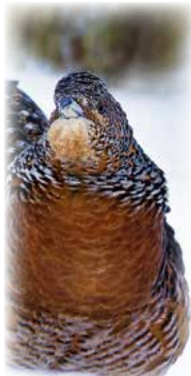
Autor: E. Marek

Bitte folgen Sie keinen Spuren abseits der Wege.